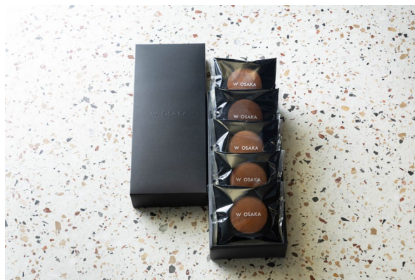
W 大阪 オリジナルチョコレートプリンどら焼き(5個入り)