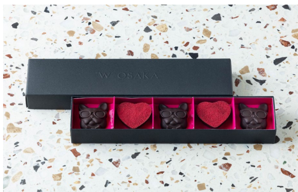
フレンチブルドッグチョコレート (バレンタイン限定)