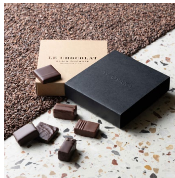
オリジナルボンボン・ショコラ BOX