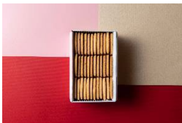
W 大阪 オリジナルクッキー缶