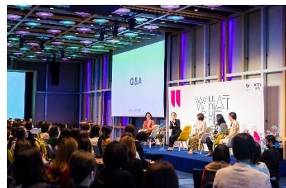
過去の「WHAT SHE SAID」の様子

時 間 18:00～21:00(17:30 ドアオープン) 場 所 2F 宴会場「Great Room(グレートルーム)」 料 金 【1部:トークイベント】 入場無料 【2部:カクテルパーティー】お1人様 5,000円 ご 予 約 WHAT SHE SAID