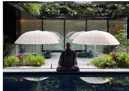
坐禅セッション イメージ

予約受付期間 ～2026年3月31日(火) 利 用 期 間 2026年3月1日(日)～2026年5月31日(日) 料 金 1室2名様 65,000円～(税・サービス料15%、宿泊税別) 部屋 タ イ プ コージー、ワンダフル、スペクタキュラー、ファンタスティックスイート、マーベラススイート 内 容 5,000 Marriott Bonvoyボーナスポイント(1滞在につき)／朝食(最大2名様分)／ 14時までのレイトチェックアウト／スペシャルアニバーサリーカクテル(最大2名様分)