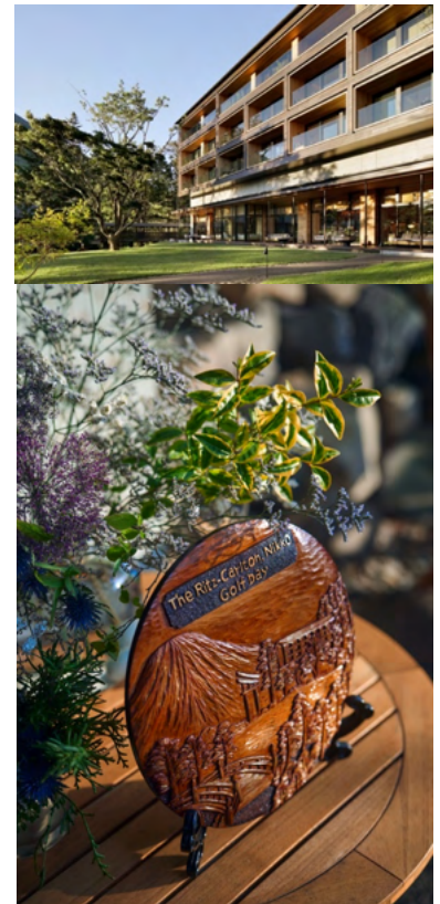
日光彫で制作した 優勝トロフィーもご用意予定

ホテル代表 0288-25-6666 rc.nikko.pbx@ritzcarlton.com