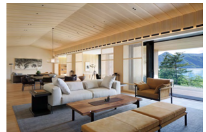
賞品 ご宿泊招待券 「ザ・リッツ・カールトン・スイート」