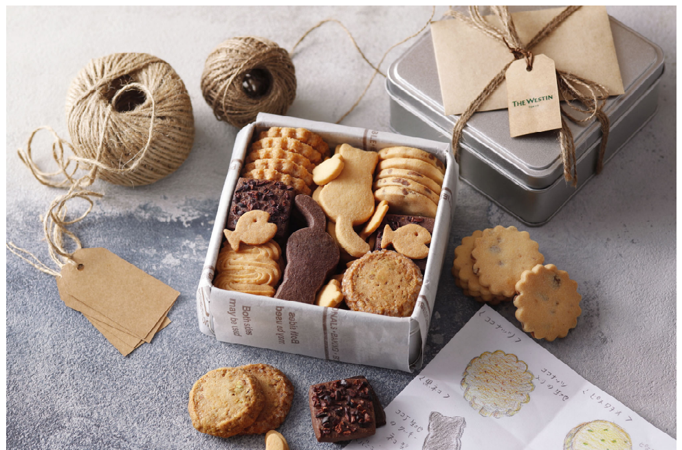
ホテルメイドクッキーアソート

蓋を開けた瞬間、可愛いネコや魚のモチーフとバターや卵の甘い香りに思わず笑顔がこぼれるクッキー缶は、大切な方へのギフトにもご自分へのご褒美にもふさわしい一品です。