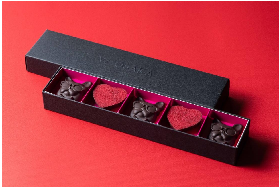
W大阪オリジナル フレンチブルドッグチョコレート(バレンタイン限定Ver.)

ラグジュアリー・ライフスタイルホテルW大阪(所在地:大阪市中央区南船場4丁目1番3号、総支配人:近藤 豪)は、2023年2月1日(水)から2月14日(火)まで、ホテル1階のアート・ペストリー・バー「MIXup(ミックスアップ)」にて、バレンタイン期間限定の商品の販売と店内でのオリジナルデザートを提供いたします。