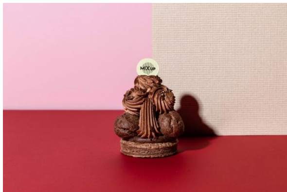
【左】ムースラズベリーショコラ、【右】サントノレショコラライチ