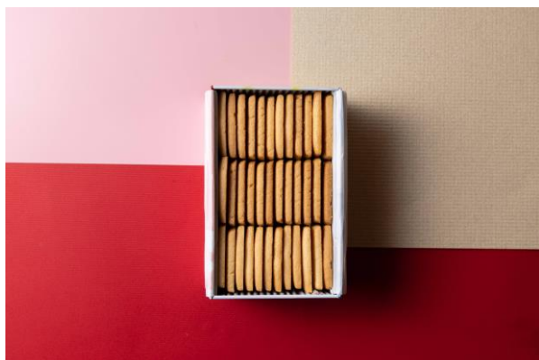
W 大阪オリジナル クッキー缶

E-mail: w.osaka.restaurantreservations@whotels.com