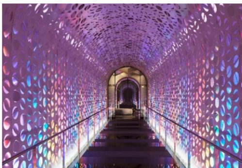
アライバルトンネル

W大阪の象徴のひとつである「アライバルトンネル」を、6月の1か月間、レインボーカラーにライトアップします。レインボーカラーはLGBTQ+の人びとが安心して利用できる施設であるということを表明するためのサインとしても広く知られています。