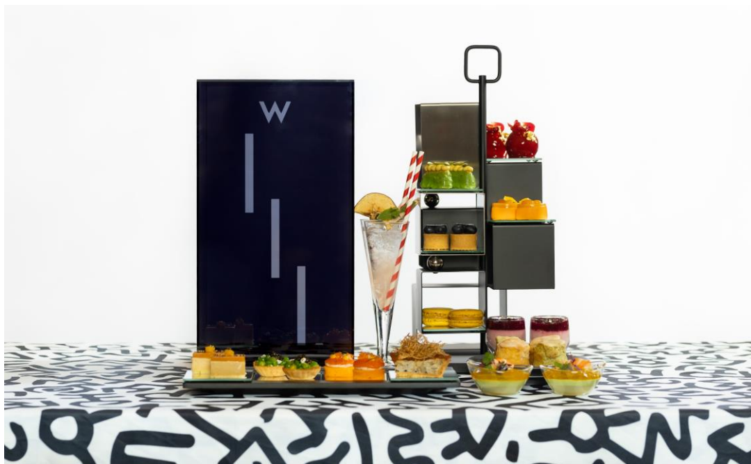
「PRIDE AFTERNOON TEA with Nakamura Keith Haring Collection」(イメージ)