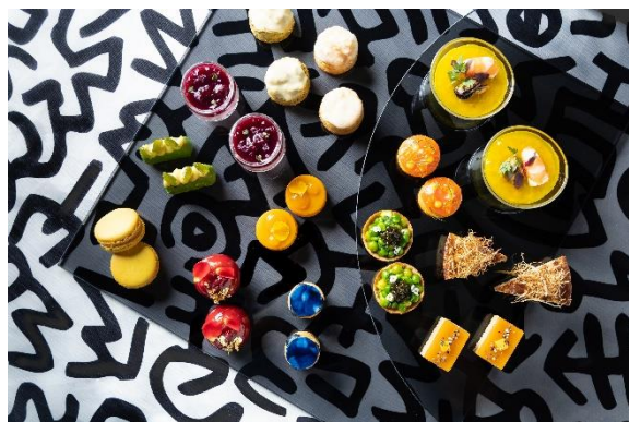
6色のスイーツとレコードジャケットがヒントのセイヴォリー