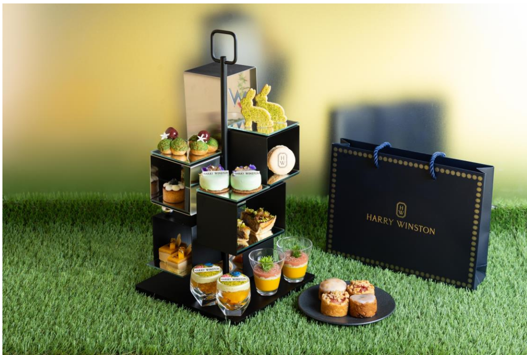
HARRY WINSTON “Tea in the Winston Maze”アフタヌーンティー(イメージ)