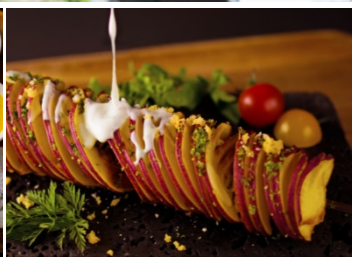
トルネードスイートポテト