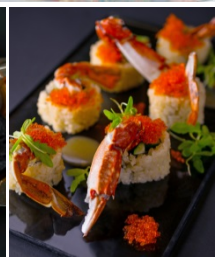
ソフトシェルクラブロール