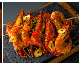
ガーリックシュリンプ