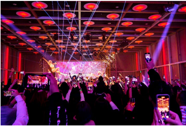
過去のカウントダウンパーティーの様子