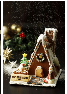
ジンジャーブレッドハウス ¥6,500(¥7,020)