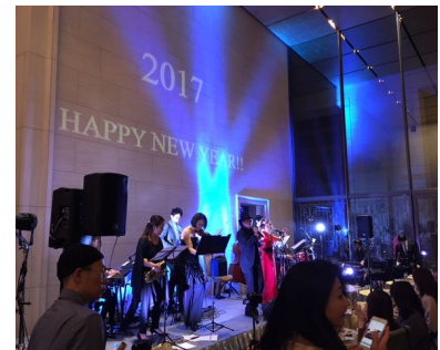
昨年のカウントダウンパーティーの様子

宿泊期間: 2018年12/31(月)チェックイン限定 料金: 2名様ご1室 100,000円~(税・サ別) 内容: ・ニューイヤーカウントダウンイベントチケット付き(ご人数分) ・レイトチェックアウト13時