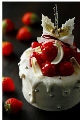
クリスマスショートケーキ ¥5,000(¥5,400)