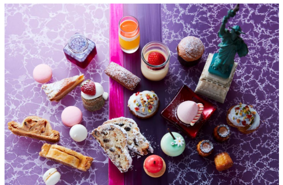
冬のNYをイメージしたアートなbuffet

期間：2018年11月5日(月)～2019年1月3日(木) ※毎日開催 時間：15:00～17:00 (2時間制) ※12/21～25は、14:30～16:30 会場：フレンチビストロ「ル ドール」(1～2F) 料金：【平日】 お1人様 ¥4,500/お子様(4～12才) ¥2,250 【土日祝】お1人様 ¥5,200/お子様(4～12才) ¥2,500 【12/21～25】お1人様 ¥6,800/お子様(4～12才) ¥2,500 ※12/21～25は、七面鳥のローストをご提供いたします。 ※税・サ込