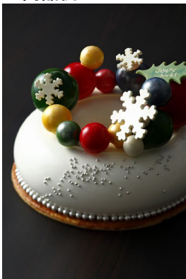
ペイルドゥ ノエル ¥15,000(¥16,200)