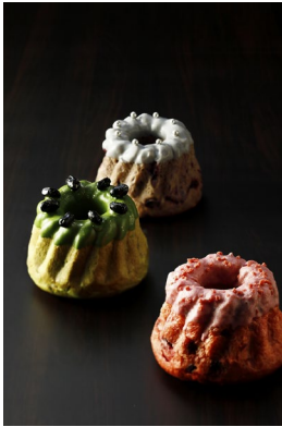
クグロフショコラドウ ノエル 各種 ¥600(¥648)