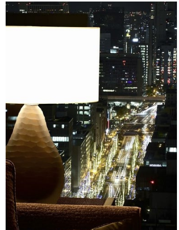
御堂筋をお楽しみ頂けるお部屋もございます

宿泊期間: ~2018年12/31(月)チェックイン限定 料金: 2名様ご1室 ¥52,000~(税・サ別) お部屋タイプ: スカイラインフロア(24階以上の高層階)のお部屋よりチョイス 内容: ・ご朝食(ランチへ変更可) ・「ルドール」のデザートブッフェ ・「セントレジスバー」のハッピーアワー ※12/23~25は、クリスマスケーキ付き