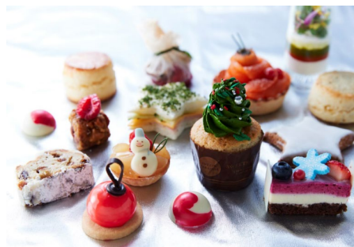
フェスティブアフタヌーンティーセット

ハニーベイクドハムとチェダーチーズのノエルサンド/フォアグラのナッツクランブルラッピング/熟成キャビアとスモーク サーモンのローズタルト赤スグリオーナメント/バルサミコ風味/モッツアレラパンナコッタとバジル、トマトのハーブツリ ー/サンタクロースから届いたトリュフ、マロン、ベリーのお祝い物