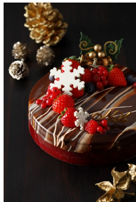
ショコラドゥ ノエル ¥6,500(¥7,020)