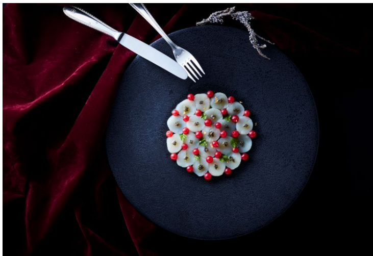
「ラベデュータ」メニューイメージ

時間： ランチタイム 「ラベデュータ」 11:30～14:30 (L.O. 14:00) / 「ルドール」 11:30～14:00 (L.O. 13:30) ディナータイム 【1部】17:30～19:30 【2部】20:00～22:00 ※12/25(日) 17:30～22:00(L.O. 21:30)