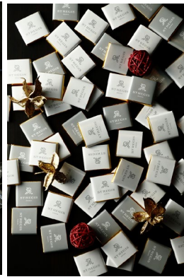
キャレチョコ(ミルク/ピター) ¥1,700(¥1,836)