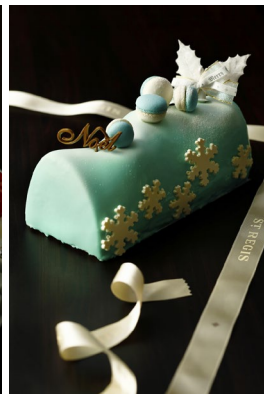
クリスタルドゥ ネージュ ¥5,500(¥5,940)