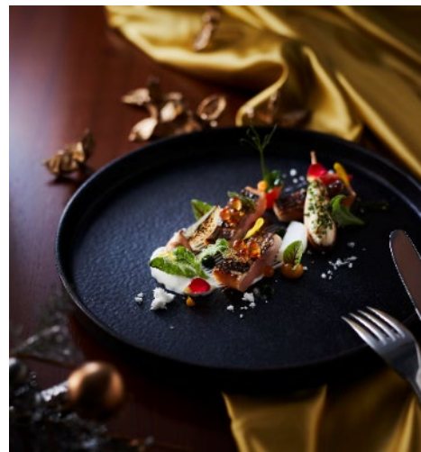
「ルドール」メニューイメージ