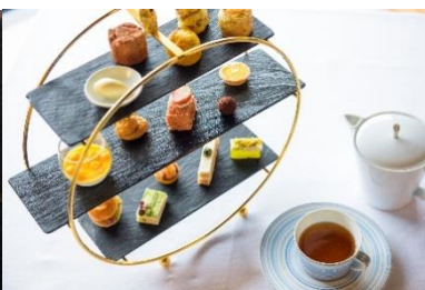
ザ・ロビーラウンジ “クリスマスアフタヌーンティー”