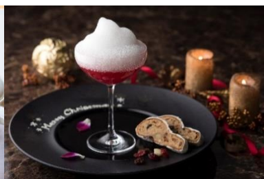
ザ・バー “クリスマスカクテル”