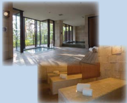
ヒートエクスペリエンスイメージ

時間・料金 : ストレッチ 60分 8,000円 + ヒートエクスペリエンスのご利用