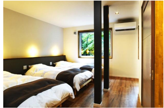
サンサン湯「サンサンの湯宿」