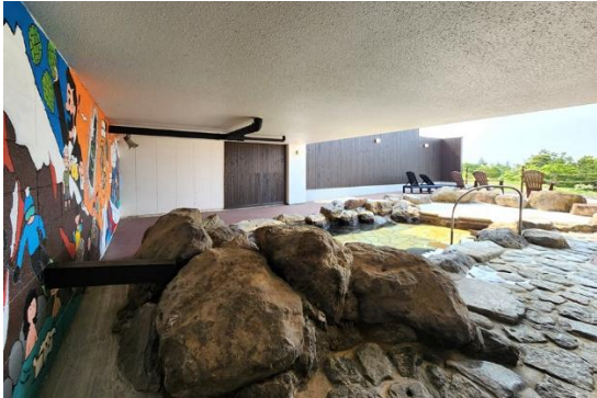
いわない高原ホテルの露天風呂