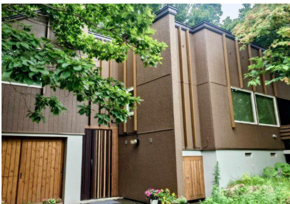
高島旅館 一棟貸し宿泊施設