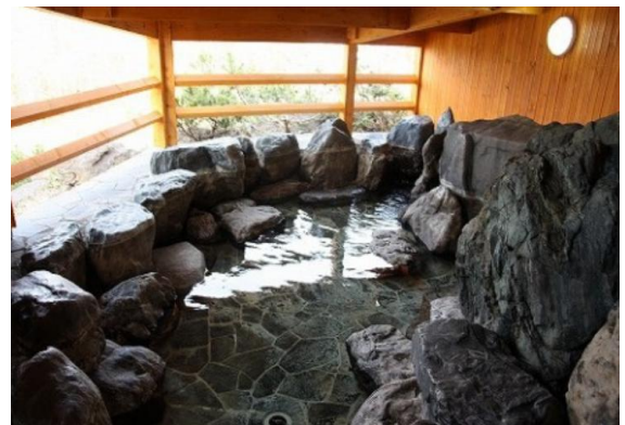
おかえりなさい 貸切風呂の空間