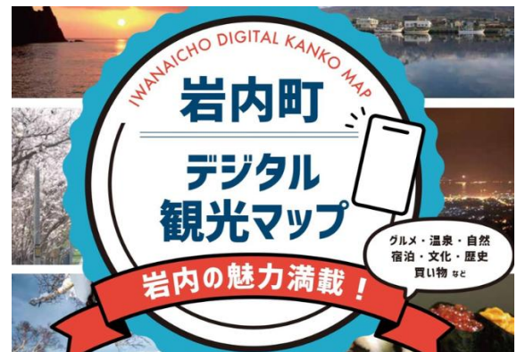
多言語対応のデジタル観光マップ