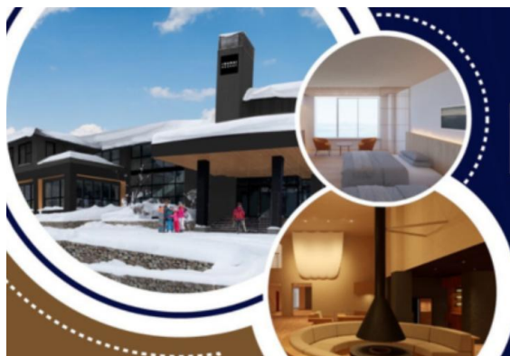
RAIDEN RESORT&SPA at Iwanai