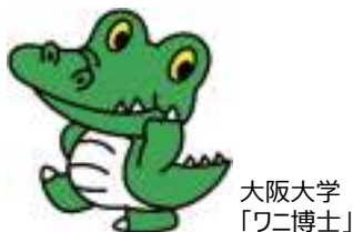
大阪大学 「ワニ博士」

大阪大学の公式マスコットキャラクターで、阪大の「知性」と大阪独自の「明るさ」が化学反応し誕生しました。