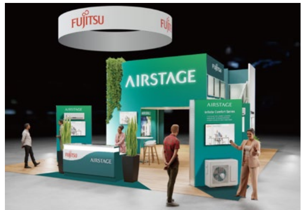
当社ブースイメージ

会 期：2024年1月22日～24日（現地時間） 来 場 者：約5万人（2023年実績約4万人） 出 展 企 業：約1,600社 会 場：McCormick Place （米国イリノイ州シカゴ） ブ ー ス 番 号：#S7764 公 式 サ イ ト： www.ahrexpo.com/