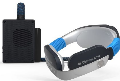
CÓmodo gear i3

当社は事業活動を通じてお客さまとともに持続可能な社会の実現へ貢献することを目指す「サステナブル経営」を推進し、重点テーマの1つに、快適・清潔・安全な空間提供を通じた「社会への貢献」を掲げています。今夏も猛暑が予想される中“暑さ”という社会課題の解決に向けて“ユーザー起点”で製品・サービス開発に取り組み、利用者満足度を向上することで貢献していきます。