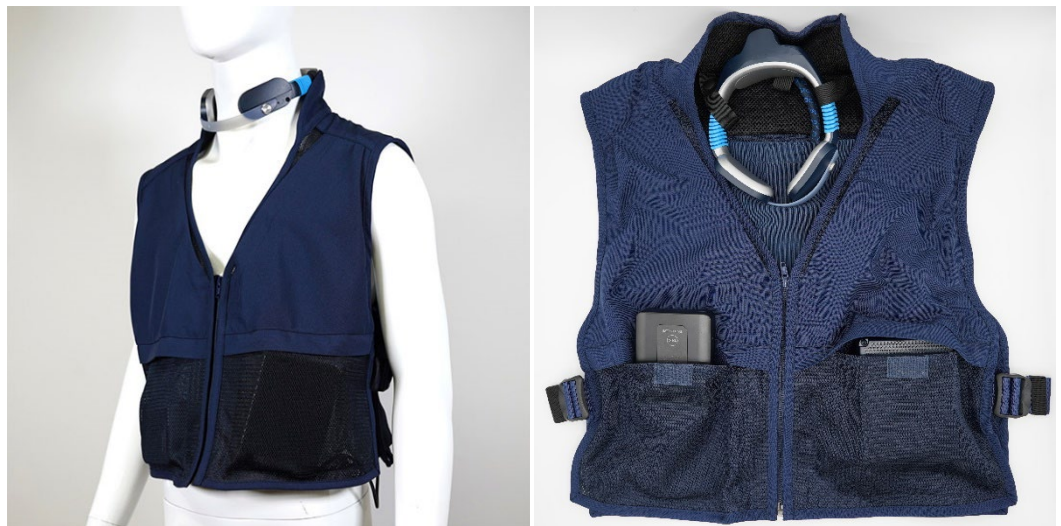
「ワークウェア」(オプション装備品)