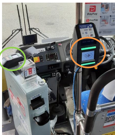
※上記写真は一例です