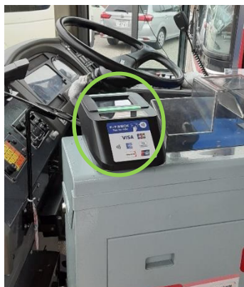
運賃箱上部のリーダー