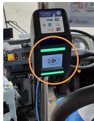
運転席後部のリーダー