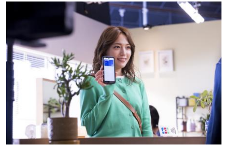
新 CM「いつでも どこでも JCB」篇 撮影の様子