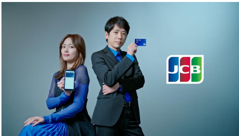
新 CM「いつでも どこでも JCB」篇より