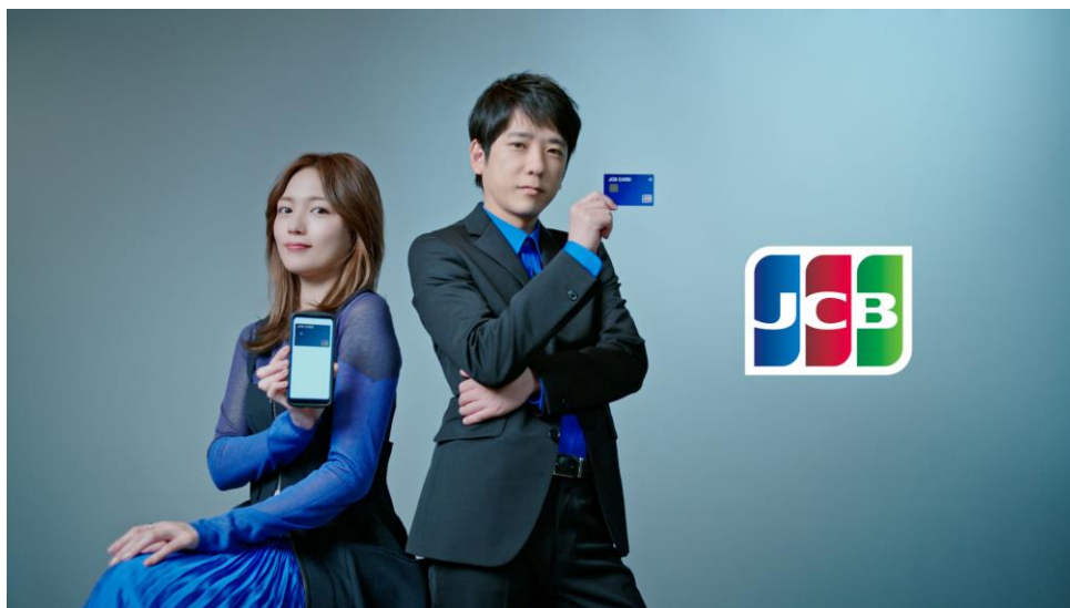
新 CM「いつでも どこでも JCB」篇より