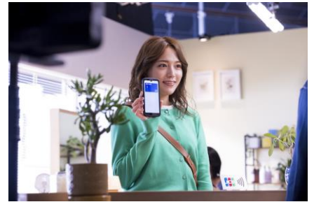
新 CM「いつでも どこでも JCB」篇 撮影の様子