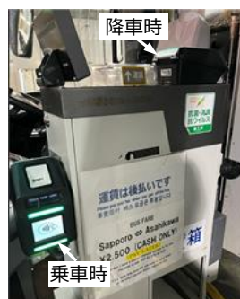
端末イメージ （あさひかわ号・流氷もんべつ号）