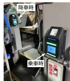
端末イメージ （おたる号）

クレジットカードやデビットカード等のタッチ決済による乗車では IC カードへのチャージが不要となり、お客様がお持ちのタッチ決済対応のカード（クレジット・デビット・プリペイド）やカードが設定されたスマートフォン等を新たに運賃箱に設置する専用の端末にタッチすることでスムーズにご乗車いただけます。