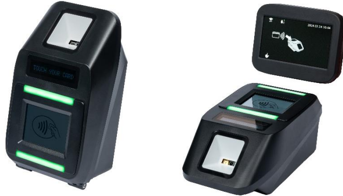
<専用リーダー(イメージ)>

お手持ちのタッチ決済対応のカード（クレジット・デビット・プリペイド）や、カードが設定されたスマートフォン等を、専用リーダーにタッチすることで、そのまま乗車（降車）いただけます。