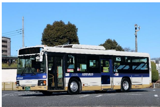
※導入車両（イメージ）

クレジットカード等によるタッチ決済は、三井住友カードが提供する公共交通機関向けソリューション「ステラトランジット」 ステラ を活用し、タッチ決済対応のカード（クレジット・デビット・プリペイド）や、同カードが設定されたスマートフォン等を、新たに運賃箱に設置する専用の端末にタッチすることでスムーズにご乗車いただけます。