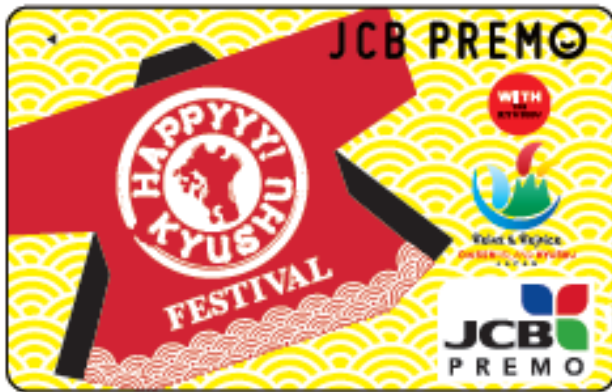
JCB プレモカード券面イメージ

リアルタイムで決済され、安心・安全に利用できます。また、JCB プレモカードマイページからいつでも残高を確認できます。