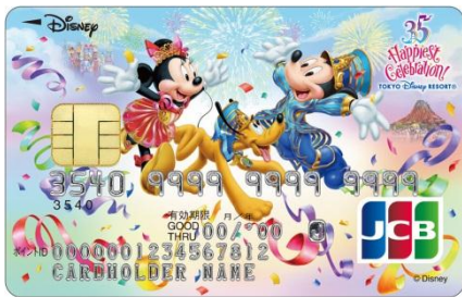
東京ディズニーリゾート®35周年記念カード （一般カード）

これまでは毎年一般カードのみ期間限定デザインカードを発行してまいりましたが、ゴールドカードをご希望のお客様ならびにWEBで入会をいただく方を対象としたデザインを新たにご用意しました。一般カードとゴールドカードは2018年4月15日（日）、WEB限定一般カードは2018年4月16日（月）から、それぞれ2019年3月25日（月）までの期間限定でご入会の募集をいたします。