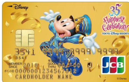
東京ディズニーリゾート®35周年記念カード （ゴールドカード）