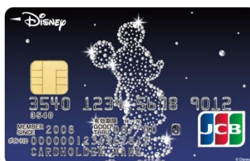
ミッキーマウス（クリスタル）