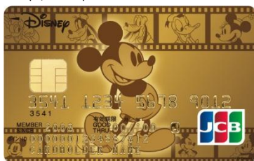
ミッキーマウス&フレンズ