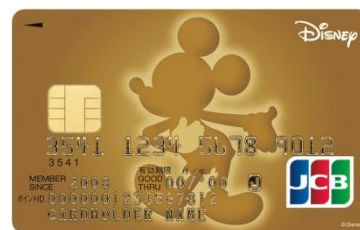
ミッキーマウス（ゴールド）