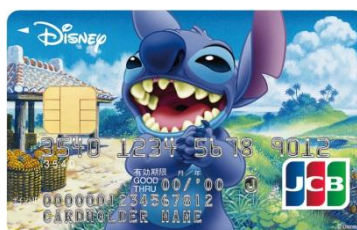
スティッチ（アイランド）