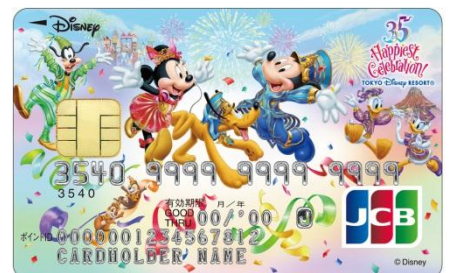
東京ディズニーリゾート®35周年記念カード （WEB限定一般カード）

「東京ディズニーリゾート®35周年 “Happiest Celebration!”」は、東京ディズニーリゾート®で2018年4月15日（日）から2019年3月25日（月）まで開催される東京ディズニーリゾート®の開園35周年のアニバーサリーイベントです。「東京ディズニーリゾート®35周年記念カード」の発行を記念して、2018年4月16日（月）よりディズニー★JCBカードに新規ご入会いただいた方に抽選で、ご利用金額に応じて「東京ディズニーリゾート®パークチケット（ペア）」を35組70名様に、「東京ディズニーランド®年間パスポート」を1名様にプレゼントするキャンペーンを実施いたします。（詳細は別紙ご参照）