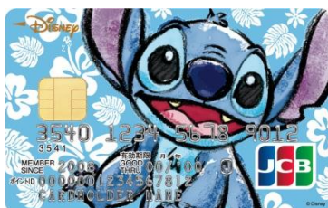
スティッチ（ハイビスカス）