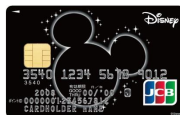
ミッキーマウス（ブラック）