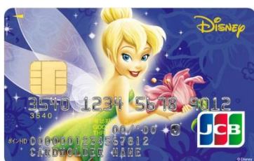
ティンカー・ベル