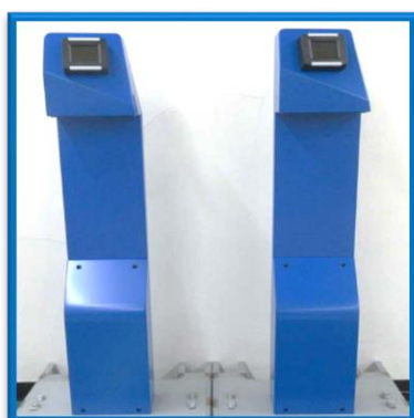
(ポール型専用端末)