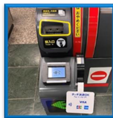
(出場時に専用端末にかざす)