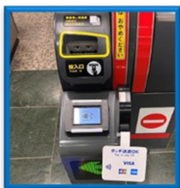
(入場時に専用端末にかざす)