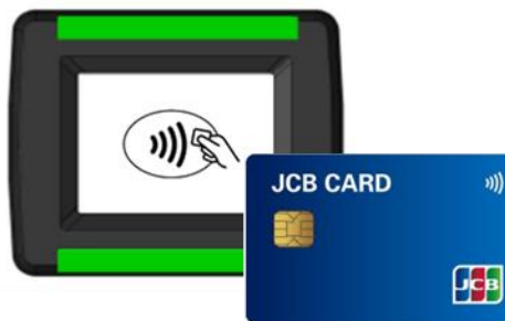
小田原機器社端末