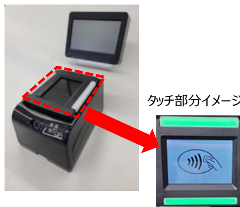
【決済端末イメージ】

クレジットカード等のタッチ決済による乗車では、ICカードへのチャージが不要となり、お客様がお持ちのタッチ決済対応のカードや同カードが設定されたスマートフォン等を、新たに乗車口付近に設置する専用のリーダーにタッチすることでご乗車いただけます。通勤などで日常的に利用される方に加えて、レジャーや旅行で利用される方、訪日外国人の方など、幅広いお客様に、より便利で快適な乗車サービスを提供してまいります。