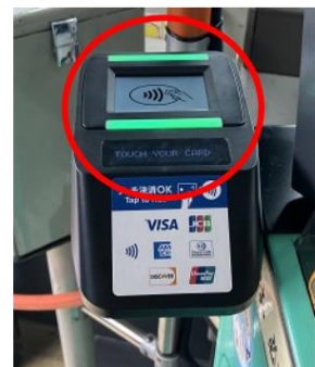
運賃箱付近のリーダー