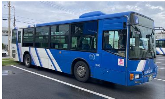
【沖縄バスが運行する路線バス】