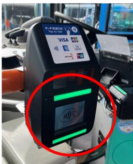
ドア付近のリーダー