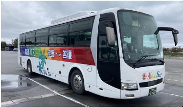
【那覇バスが運行する路線バス】