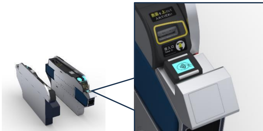
【自動改札機のイメージ】

実証実験の開始にあたり、札幌市営地下鉄全46駅の一部自動改札機にタッチ決済読取部を搭載します。