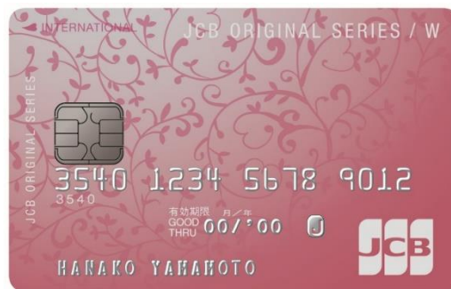
<JCB CARD W plus L>

「JCB CARD W」は、年会費無料・高いポイント還元率・39歳以下対象・WEB 入会限定のおトクなクレジットカードです。「JCB CARD W plus L」では、「JCB CARD W」の特徴に加えて、女性に嬉しい特典をご用意しています。