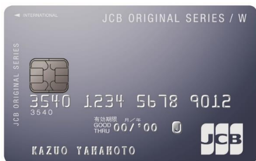
<JCB CARD W>