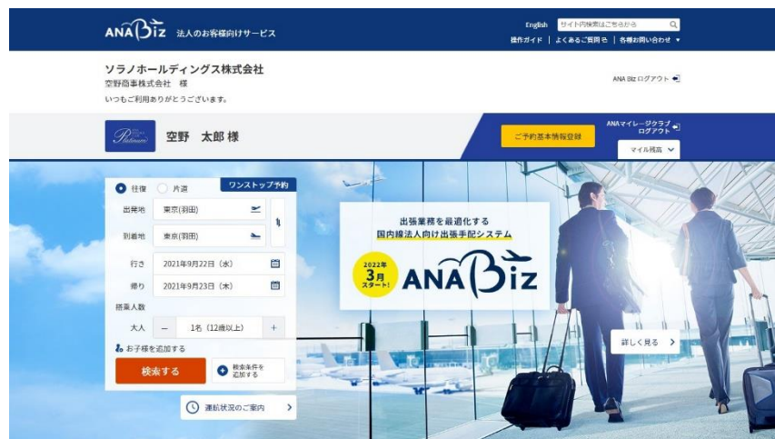
「ANA Biz」サイト画面イメージ