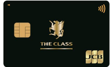
<JCB THE CLASS>

JCB は、日本発唯一の国際カードブランド運営会社として長年にわたり培ったノウハウを活かし、全国99(八十二カードを含む)の金融機関とフランチャイズ契約を締結し、カード事業をサポートしています。