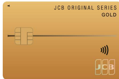
<JCB Original Series ゴールド>