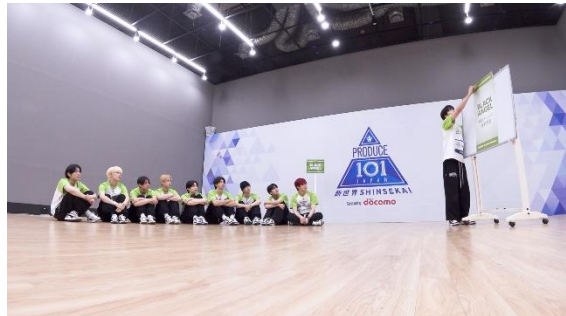
新世界