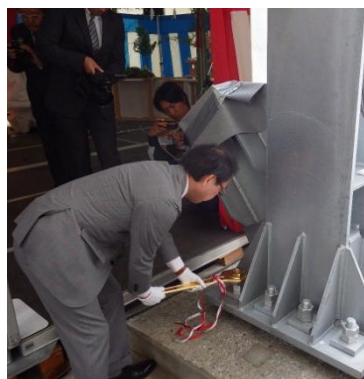
写真:立柱式の様子