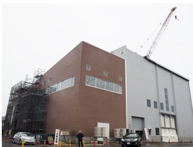
写真:現在の発電所の様子

木質バイオマス発電事業は、バイオマス燃料の調達量を安定的に確保することが事業のポイントとなりますが、本プロジェクトでは地元の林業者等と連携することで地域の間伐材を長期間安定的に調達する体制を構築し、さらに補助燃料としてPKS(Palm Kernel Shell)等を調達することを計画しています。また、地元林業者との連携においては、これまで需要の乏しかった県内未利用材を本プロジェクトで有効活用することで地元林業への波及効果、雇用効果等の地域振興が期待できます。