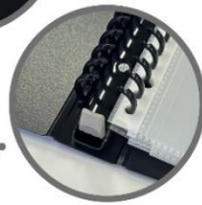
とじ具オープンレバー:グレー