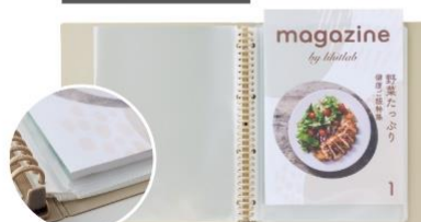
マチ付きポケット