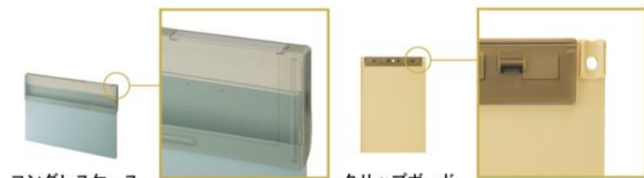
コングレスケース