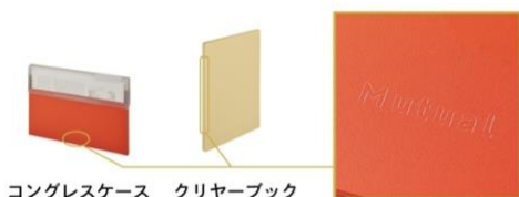
コングレスケース クリヤーブック