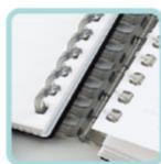
□1 クリアー (半透明)

自分らしくカスタムすることもできるクリアーに、中が見えない不透明ブラックで表紙をラインナップ。とじ具も色味をおさえたシックなカラーリングでまとめました。