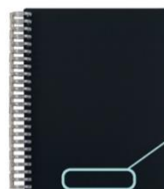
■24 ブラック (不透明)