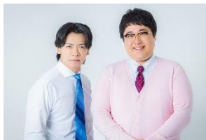
マヂカルラブリー(野田クリスタル / 村上)

2007年2月結成。2017年のM-1グランプリで決勝進出、最下位に沈むも2020年のM-1グランプリで優勝。キングオブコント、2018年・2021年決勝進出。野田クリスタルは2020年R-1ぐらんぷりで優勝もしており、史上初の3大会全てでのファイナリスト経験者。現在、バラエティー番組、ラジオ、CMなど多方面で活躍。