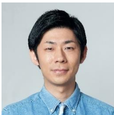
森本 晋太郎 (トンツカタン)