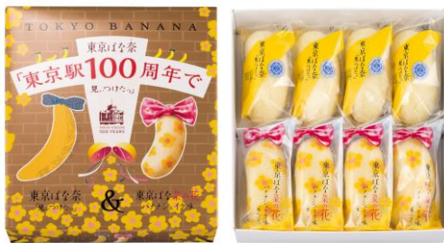
東京ばな奈 「東京駅 100 周年で見つけた」 8 個入 (各 4 個) 1,000 円

東京ばな奈と東京ばな菜の花の詰合せ商品が 数量限定で登場 [100 周年記念特別パッケージ]