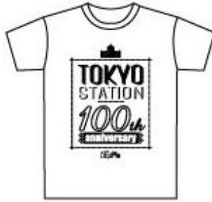
T シャツ (3 種類各 S/M/L) 3,800 円