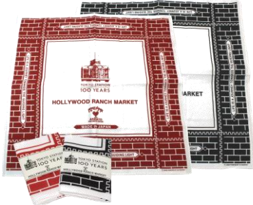
東京バンダナ (2色) 1,400 円