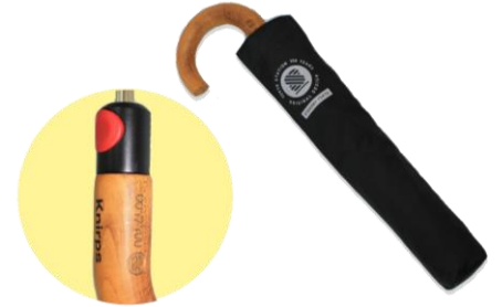
折傘 Topmatic SL 10,000 円

折傘の元祖クニルプスが東京駅開業 100 周年を記念して 100 本限定でオリジナル デザインを製作 (シリアルナンバー入)