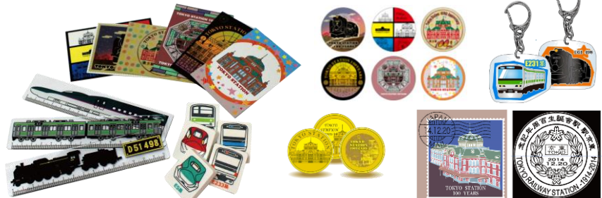
駅舎ステッカー 380 円 列車ものさし 360 円 消しゴム 199 円

東京駅開業 100 周年を記念した “ここでしか買えない” “オリジナル鉄道グッズ も多数ご用意