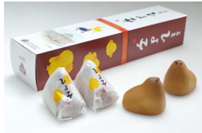
「名菓ひよ子 東京駅 100 周年記念」 6 個入 741 円