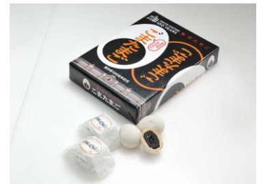
「東京たまご ごまたまご 東京駅 100 周年記念」 12 個入 1,000 円

※価格はすべて税抜きです ※こちら以外にも多数、オリジナル商品を取り揃えております