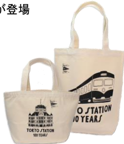
トートバック (28 種類) 1,500 円～

代官山と渋谷に店舗を構える Aqvii がア クセサリーに加え、イラストレーター宮 田翔氏とコラボレーションしたトートバ ックが登場