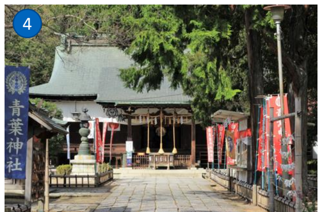
①懐かしい雰囲気の「仙台浅草」 ②「北仙台駅」の外観 ③北四番丁にも隣接する「愛宕上杉通」 ④伊達政宗公を祀る「青葉神社」