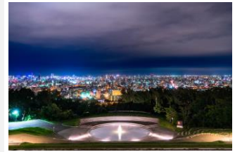
旭山記念公園

市電路線の西側に広がる幌西・伏見エリアに位置する「西線11条」駅、「西線16条」駅。中央区内だが、旭山記念公園や藻岩山の緑とゆったりとした雰囲気がある街だ。都心に近い「西線11条」駅は「不動産の資産価値が高そう」（3位）という点も街の魅力。札幌市中央図書館や、文化芸術を通して地域の交流を育む「あけぼのアート&コミュニティセンター」も近く、29位からジャンプアップした「西線16条」は、街の魅力の6位に「魅力的なコミュニティセンターや公民館がある」が入っている。