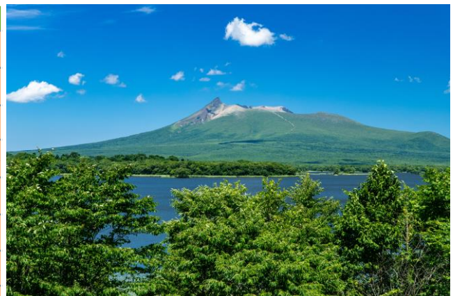
大沼や北海道駒ヶ岳がある大沼国定公園