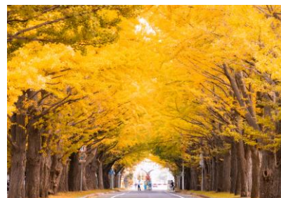
北大イチョウ並木