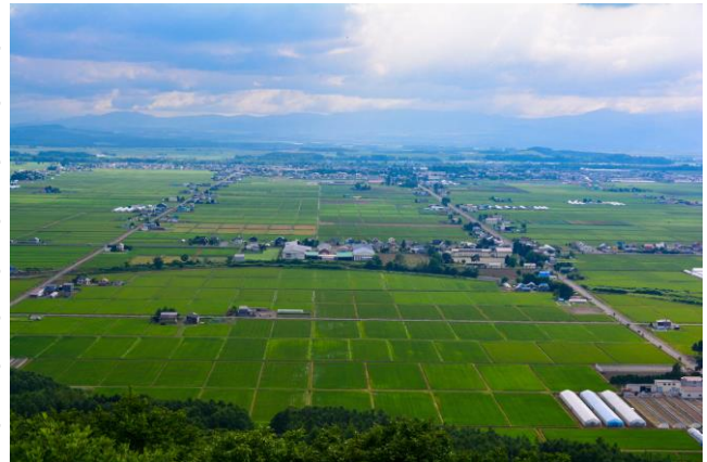
上川郡東川町の風景