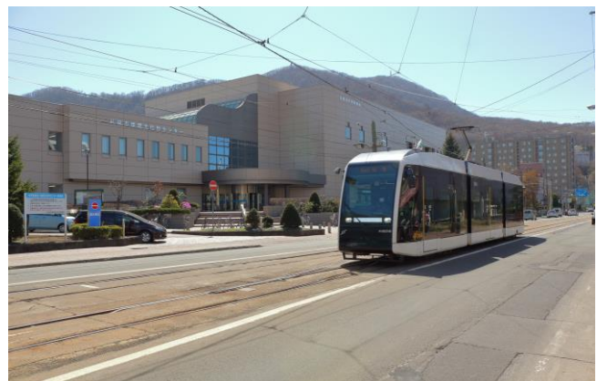
札幌市中央図書館と札幌市電両（画像／PIXTA）