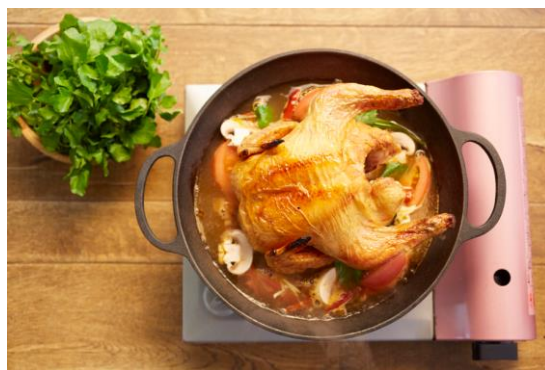
[Q] 年末は糖質やカロリーを気にしますか