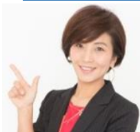
「ホットペッパーグルメ外食総研」