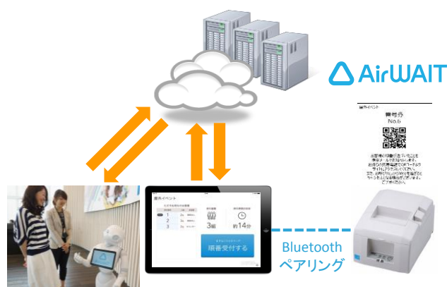
▲Pepperと『Airウェイト』による受付イメージ

http://www.softbank.jp/robot/special/pepper-world/