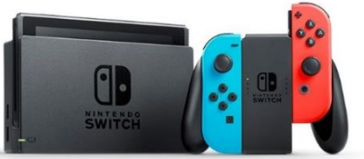
Nintendo Switchのロゴ・Nintendo Switchは任天堂の商標です。

* 詳細はこちら https://airregi.jp/shift/campaign/201907