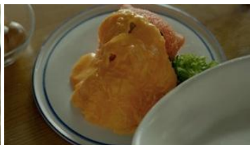
「かぶっちゃった」篇