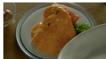
かぶっちゃった篇