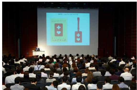
ヘルプマーク紹介の様子