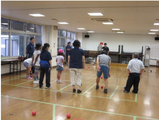
ボッチャ体験会の様子

受付では、ヘルプマークの展示を行い、外見からは分からなくても援助が必要な方への理解と思いやりのある行動を呼びかけました。「見た目では分かってもらえない。身に着けやすいデザインなので使ってみたい。」「このマークがあると困っている方に声を掛けやすい。」といった声をいただくなど、多くの方にヘルプマークについての理解を深めていただく機会となりました。