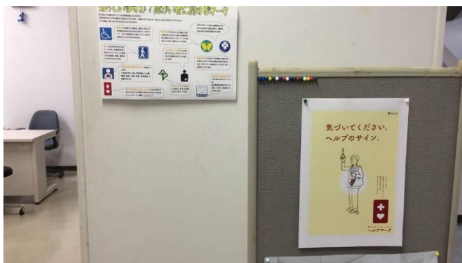
保健室入口の掲示板に掲出

今後、障害者差別解消法が施行されることもあり、学内での整備や対策も進めているといったことと連動する形で、まずは保健室内へのポスター掲示というところから取組が始まっています。