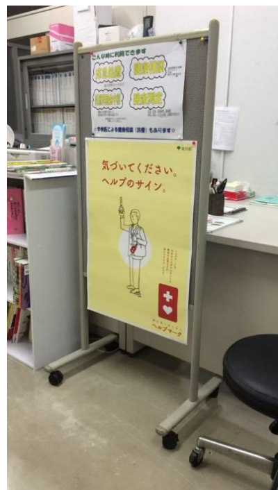
保健室内にも掲出