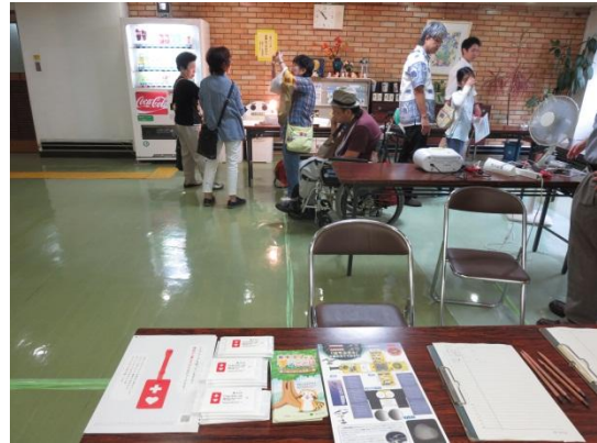
受付でのヘルプマーク紹介