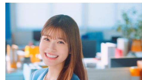
⑥「覚えてください！」とストレートに訴えかける生見さん。