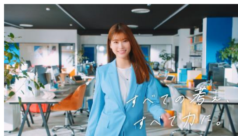
⑤スタイリッシュなウォーキングで堂々とメッセージを伝えます。