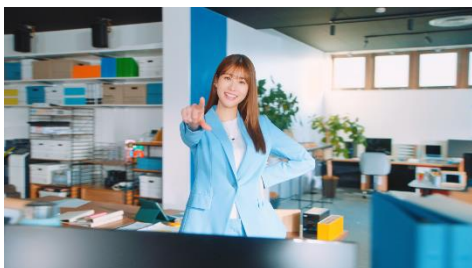
②「あれも！」と、オフィスのどこかを指差す生見さん。背景がぐるりと動き出す。